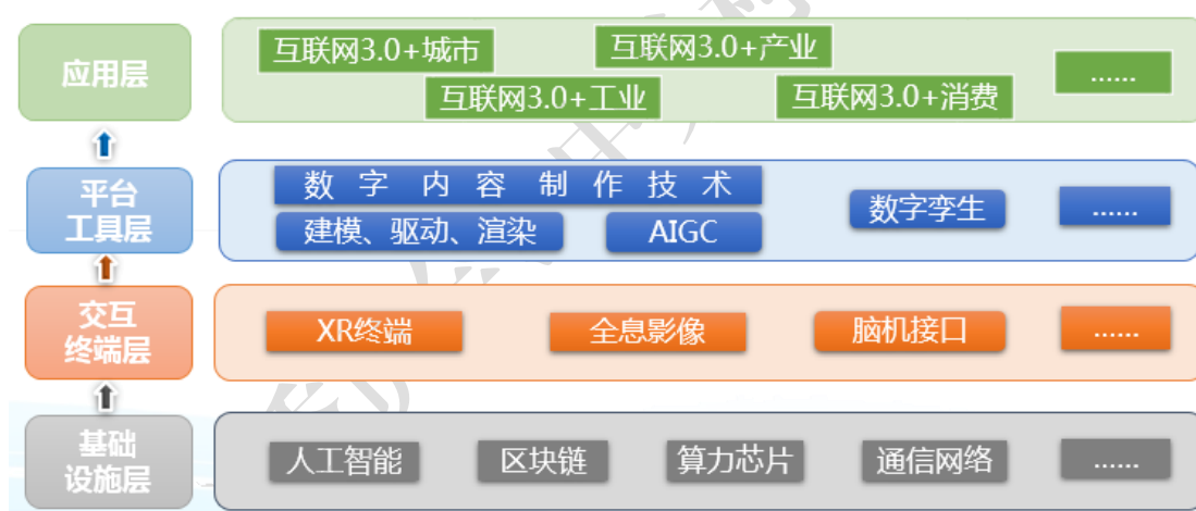
图 3 互联网 3.0 体系架构

互联网 3.0 体系架构可分为基础设施、交互终端、平台工具和应用等四层。 基础设施层 提供互联网 3.0 运行所必需的基础设施保障，主要包括人工智能、区块链、算力芯片、通信网络等技术。 交互终端层 为虚实世界感知交互提供设备和技术支持，主要包括 XR 终端、全息影像、脑机接口等技术。 平台工具层 为构建虚拟空间中的行为主体、数字化环境等提供技术支撑，主要涉及数字内容制作技术、数字孪生等。 应用层 面向消费娱乐、工业制造、政务服务等方面提供应用服务，数字人、虚拟空间、数字资产流通服务平台是具有互联网 3.0 特色的典型应用载体，城市、工业、产业、消费是互联网 3.0 的重要应用场景。