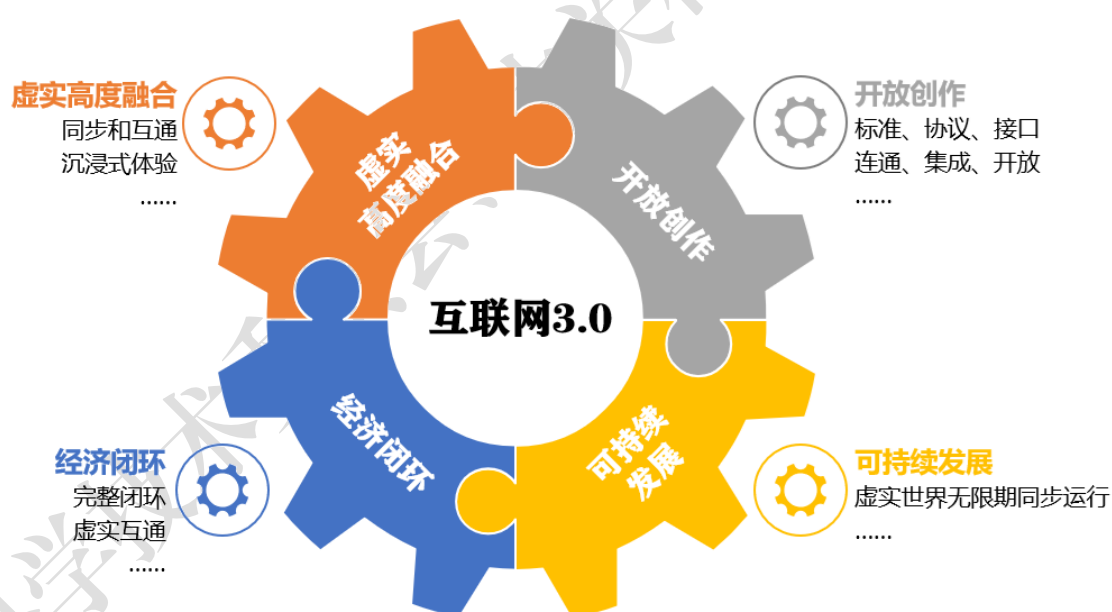
图 2 成熟形态互联网 3.0 应具备的核心属性

归纳为四点，即虚实高度融合、开放创作、经济闭环、可持续发展。 虚实高度融合 指虚拟空间与现实空间通过数字孪生等相关技术保持高度同步和互通，用户在虚拟空间中进行交互时可得到接近现实世界的沉浸式体验。 开放创作 指工具软件可通过标准、协议、接口等方式实现连通、集成和开放，支持用户根据不同需求在虚拟空间进行创作，丰富内容生态。 经济闭环 指用户在虚拟空间内的生产、分配、交换、消费等经济活动形成完整闭环，并可和现实世界经济活动形成互通。 可持续发展 指虚拟空间与现实世界保持无限期地同步运行，任何个人用户或组织的行为不会对互联网 3.0 的平稳运行产生影响。