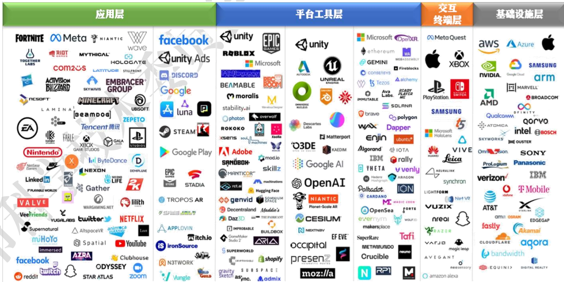
图 4 全球互联网 3.0 产业图谱 2

据彭博行业研究预计，互联网 3.0 相关业务的市场规模将在 2024 年达到 8000 亿美元，2030 年将快速扩张到 15000 亿美元，六年的时间里几乎实现翻倍增长，并将撬动数十万亿相关市场。目前，国内外互联网 3.0 产业发展概念的推动者主要是 Meta、谷歌、苹果、微软、英伟达、Epic、百度、华为、腾讯、字节跳动等产业巨头公司，人工智能、XR 终端、数字人、NFT 等互联网 3.0 关键技术、工具平台和应用快速发展。